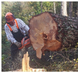
Dolf heeft hier een zee-den geveld.