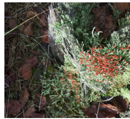
Rood bekertjesmos op stronk.