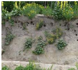
Zomer: Braam bedreigt de openingen af te sluiten.