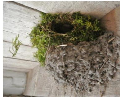
Tijdens de kastcontrole kwamen Ad en Peter bij een schuurtje waar ze een nest van een winterkoning aantreffen, gemaakt bóven op een oud nest van een boerenwaluw.