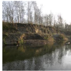
De voorste bult moest helemaal weg.