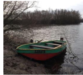
Veel werd vooraf geregeld, o.a. de boot.