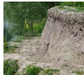
Situatie ná de snoeiactie. Resultaat 72 bezette nesten.