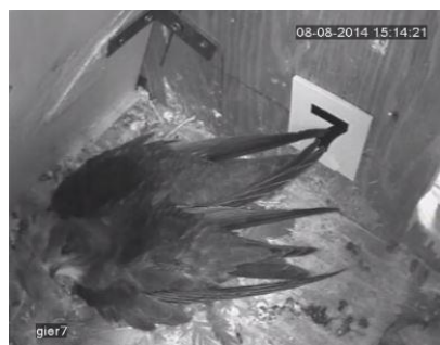
Dit paartje in kast 7 was goed te volgen in aanloop van de eileg.