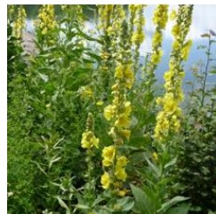
Prachtige stalkaars op de wal.