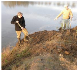
Winter: Alle zand werd met de schop afgestoken.

Enkele weken later zagen we al resultaten en op 20 mei werden ruim 50 bezette nesten geteld. Wel kon je ook zien dat de begroeiing her en der het invliegen van de nesten ging belemmeren. Daarom besloten we op 21 juni nogmaals over te varen met snoeischaars. Zo konden we ter plekke de bezette nesten nauwkeurig vaststellen: Liefst 72 !