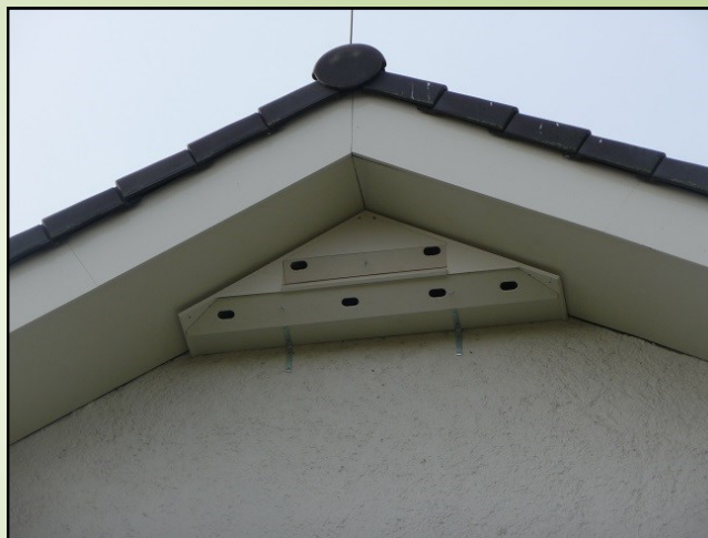
De gierzwaluwkasten aan het kruisgebouw en aan de noordoostgevel van De Peppel zijn op maat gemaakt