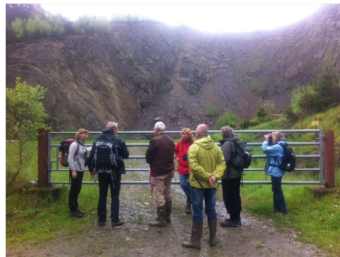
Bij deze groeve zou de oehoe kunnen zitten. Wij hebben hem niet gezien.

Natuurlijk ook volop huis- en boerenzwaluwen in het dorp. We zijn gaan wandelen en naar gelang de dag vorderde werd het weer beter. Het landschap bestond uit bloeiende weiden, veelal omzoomd met struikgewas en hagen afgewisseld met stukken bos. Het viel ons op dat de natuur achterliep op die van Nederland. Vanaf de lente tot het eind van de zomer komt de rode wouw in het gebied voor. Zodra de zon doorbrak zagen we deze schitterende roofvogels regelmatig cirkelen op thermiek over het dal. Op weg naar een steengroeve, waar we de oehoe konden spotten,