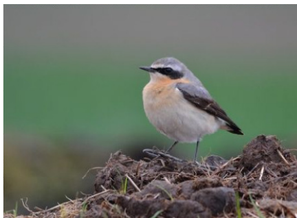
Tapuiten moeten het vooral hebben van open, kale, zandige vlaktes. Heide- en duingebieden vormden lange tijd de ideale biotoop.

Hoe kon het zo snel zo fout gaan? Tapuiten moeten het hebben van open en schaars begroeide gebieden: heide, duinen, terrils, zandvlakten. Maar net dat habitat verdween in ijltempo. Hoezo? Er zijn toch nog duin- en heidegebieden? Toch wel maar die worden veel minder intensief begraasd dan vroeger waardoor de heide ging vergrassen en de duinen dichtgroeiden met Duindoorn. De oorzaak van die vegetatieveranderingen moet deels ook gezocht worden in zure regen en een toegenomen stikstofdepositie. En ook de crash in het Vlaamse konijnenbestand heeft de tapuit geen goed gedaan. Minder konijnen (o.a. als gevolg van myxomatose en het viraal haemoragisch syndroom) leidde tot minder begrazing en minder geschikte nestholtes. En net die konijnenholen zijn een must voor de tapuit, als broedholte. Alsof dat nog niet genoeg was, werden bijna alle duinen volgebouwd en verdreef een sterk toegenomen recreatie de resterende paartjes naar afgesloten gebieden als militaire domeinen en natuureservaten.