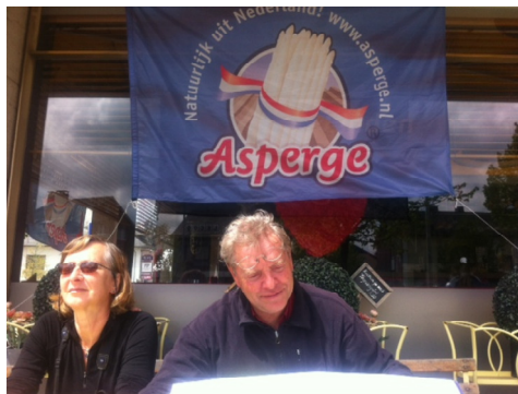
Wat zullen we vandaag weer eens nemen?