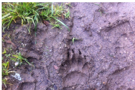
Ook dassen komen in het gebied voor.

Dank zij enkele deskundigen onder ons was het een leerzaam weekend en kunnen we ook terugkijken op een gezellig weekend met elkaar.