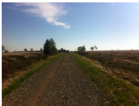
Lange rechte paden in de Hoge Venen.