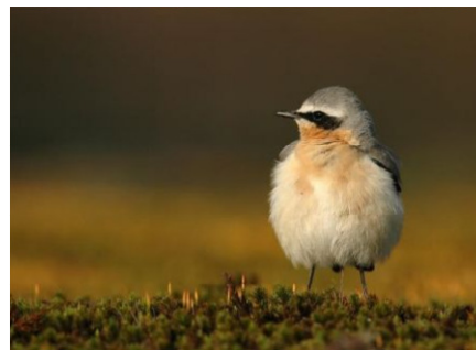
In 2012 verloor Vlaanderen de Tapuit als broedvogel. Ook de kans op het herstel van de Vlaamse broedpopulatie is bitter klein.