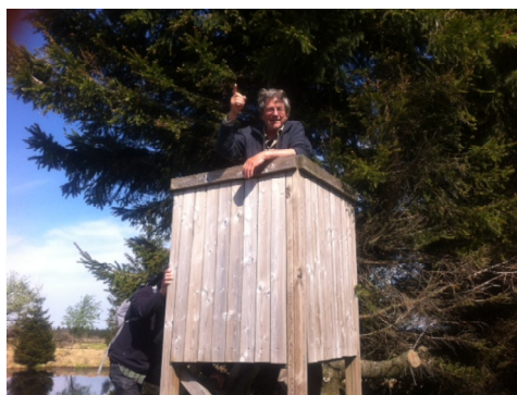
Toegesproken worden vanaf de 'kansel'.