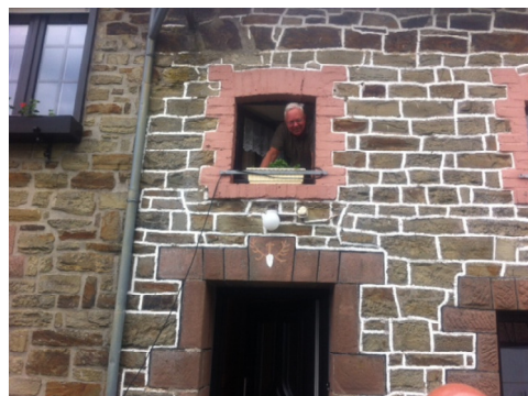
Een gedeelte van de aanbouw met witgeschilderde voegen.