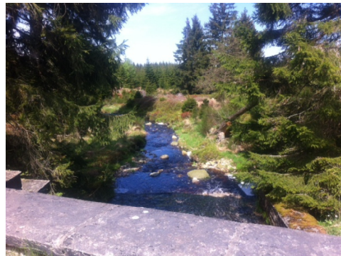
Kabbelende beekjes door het landschap waar de waterspreeuw zich thuis voelt.