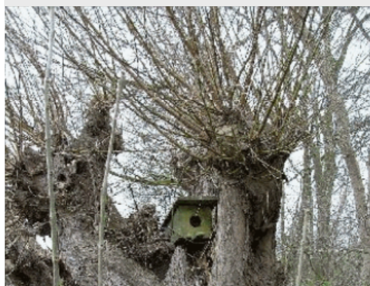
Na jaren van snoeien wordt de nestkast langzaam overbodig en heeft z'n plicht gedaan.