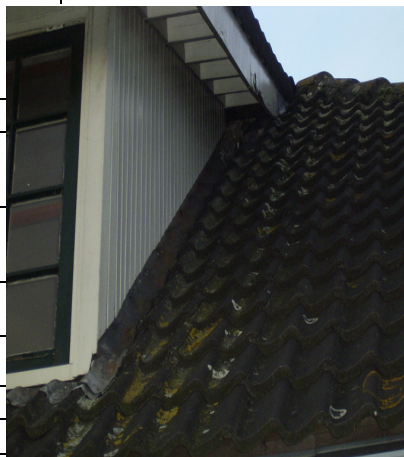
Zolang de Steenuil niet voldoende kan riezen tussen nestkast of een natuurlijke holte is ie voorlopig aan gewezen op dit soort plaatsen. Deze foto werd me toegezonden uit Tilburg-Noord.