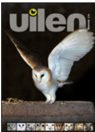
Omslag van het 2 de nummer