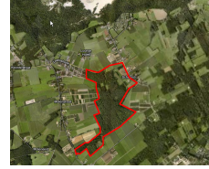
De grenzen bepaal je zelf.

Geef je gebied door aan jmvanrijsewijk@home.nl en je krijgt een kaartje met de grenzen toegestuurd.