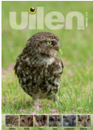
Omslag 1 ste nummer

Een 'abonnement' op het ene nummer dat iedere december verschijnt kost € 5,- (€ 7,50 inclusief verzending) stuur een email aan uilen@steenuil.nl , o.v.v. 'Abonnement UILEN' en je naam- en adresgegevens.