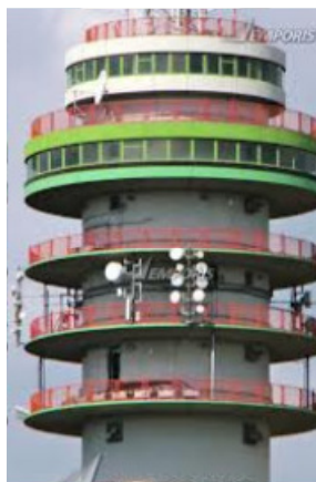
Bovenste gedeelte van de tvtoren met de 5 ringen.