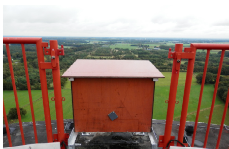
Een gedeelte van het hekwerk is er tussenuit gehaald. De kast is geheel van trespal en de constructie van gegalvaniseerd staal gemaakt. De nestbodem bestaat uit kiezelsteentjes.