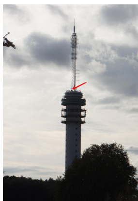
Op de bovenste ring is de kast geplaatst.