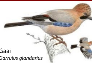
Gaai Garrulus glandarius