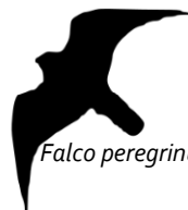
Falco peregrinus - de Slechtvalk

Vanaf nu houden we de boel in de gaten en in de zomer gaan we hulp bieden bij de controle van de kast. En wie weet....misschien moet er wel geringd worden!