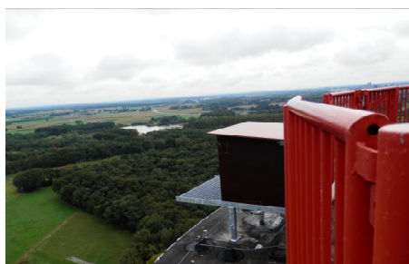
De opening van de kast hangt precies op het oosten. De waterplas in de verte is de Noorderplas.