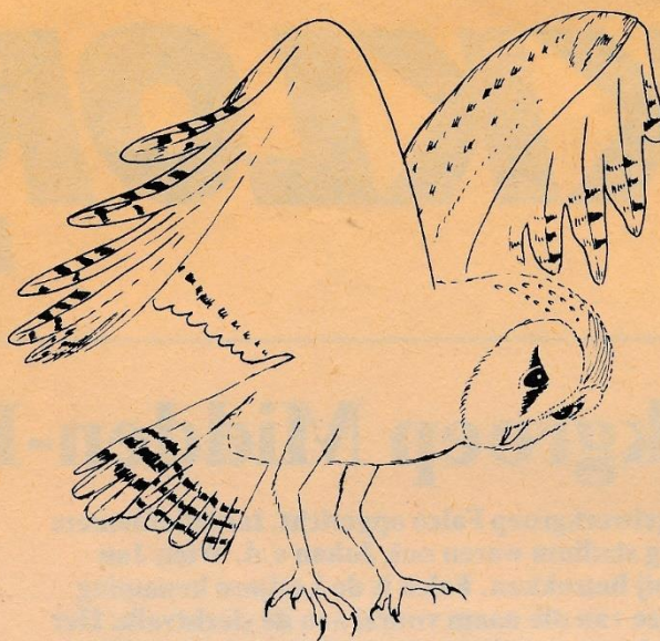
Een tekening van de kerkuil. In Oisterwijk broedt deze vogel alleen in een nestkastje op de Petruskerk.

Het onderhoud van knotwilgen is noodzakelijk, wil de onderstam niet bezwijken. Ook zijn knotwilgen interessante bomen voor insecten, planten en vogels. De holtes van knotwilgen zijn ideale broedplaatsen voor de steenuil. Het