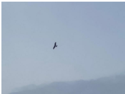
Zwarte wouw.

15/11 Ondanks dat het is stil in de natuur, in de Brand een groep van +/-80 sijsjes , 2 roepende waterrallen en cettiszanger (JvR).