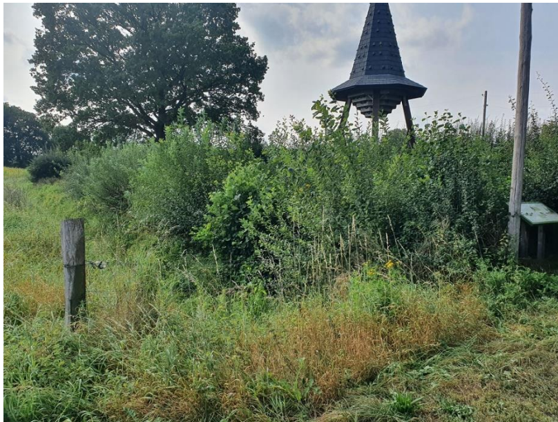
Snoeiwerk was dringend nodig.

Zoals iedereen waarschijnlijk wel heeft gemerkt, is het dit jaar een echt groeiseizoen geweest. Genoeg regen en warmte, ideaal voor al het groen. Zo ook bij de zwaluwtoren in Moergestel. Omdat er in coronatijd geen onderhoud is gepleegd, was de beplanting inmiddels meters hoog gegroeid. Dat was de rede om een dringende oproep te doen aan de leden om nog vóór de winter te snoeien, te maaien en boom opschot te verwijderen.