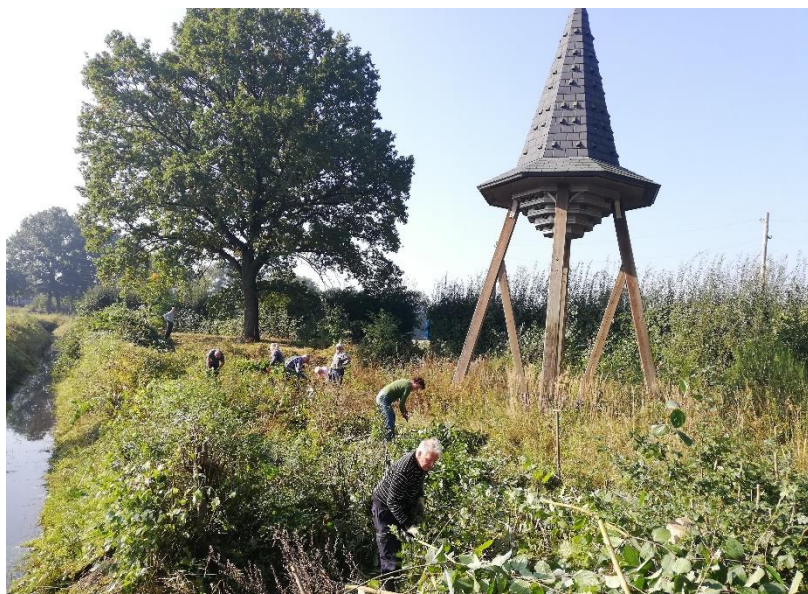
Vele handen maken licht werk.

Zaterdag 9 oktober was een uitgelezen dag. Droog en zonnig weer. Ook al had je maar een uurtje om te helpen...iedereen was welkom. Een tiental leden van het IVN Oisterwijk en enkele leden van onze Vogelwerkgroep waren die dag (of een gedeelte daarvan) aanwezig. Er is hard gewerkt. Op z'n tijd een kopje koffie aangevuld met Brabants worstenbrood hielp daarbij.