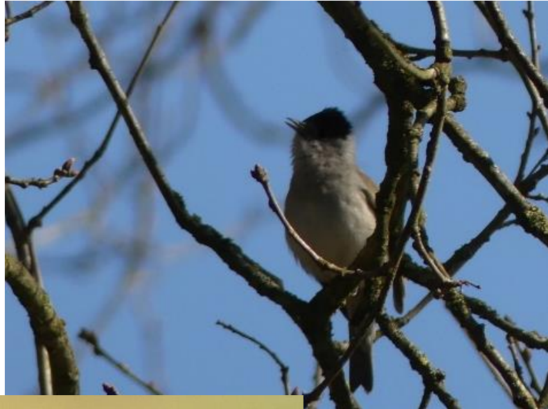
Martien van Liempd Zwartkop

Alle andere foto's vind je op onze website via de link PUBLICATIES .