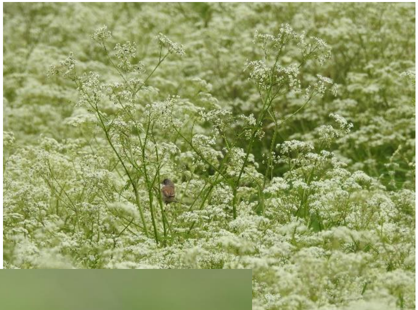
Corine Goldschmid Grasmus