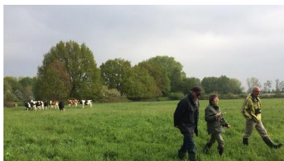
Lopend door de weilanden werden we op de voet gevolgd door nieuwgierige kalveren.

Boomkruiper, boompieper, buizerd, ekster, gaai, grasmus, graspieper, grauwe gans, groenling, grote bonte specht, grote lijster, heggemus, houtduif, kauw, kleine plevier, koekoek, koolmees, merel, nijlgans, oeverzwaluw, putter, pimpelmees, roodborst, roodborsttapuit, spotvogel, spreeuw, tjiftjaf, torenvalk, tuinfluiter, vink, wilde eend, winterkoning, witte kwikstaart, zanglijster, zwarte kraai, zwarte specht, zwartkop