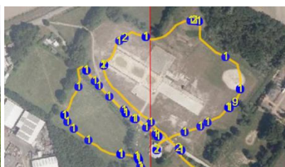
Het gelopen traject. De gegevens werden opgeslagen met Avimap.