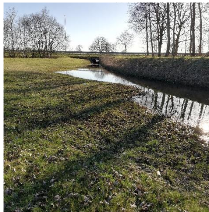
Postzegelnatuur Gilze

Ik fietste langs de "Kaaistoep" en door het "Stadsbos" richting Gilze, zag een blauwe reiger, bonte spechten en hoorde een zwarte specht. Op de Gilzerbaan gekomen zag ik veel mountainbikers op de paadjes door het bos. Voorbij de golfbaan nam ik een parallelweg naar de A58 en mijn oog viel op een fraai stukje landschap met een beekmeander, een faunatunnel en een zandwal waar een deur in zat: een vlermuizenkelder dacht ik meteen. Vreemd genoeg stond de deur op een kier. Ik glipte de donkere ruimte in en met de lamp op mijn smartphone kon ik genoeg zien. De kelder werd goed benut door vlinders die omgekeerd aan het plafond hingen. In de spleet van een steen zat een vlemuis in diepe winterslaap. De scherpe afscheiding tussen bruine rug en bijna witte buik was opvallend. Ik maakte een foto en kwam thuis bracht ik hem op franjestaart maar ik kan er naast zitten. Stil maar snel verliet ik de kelder weer omdat ik wist dat ik hier niet hoorde te zijn.