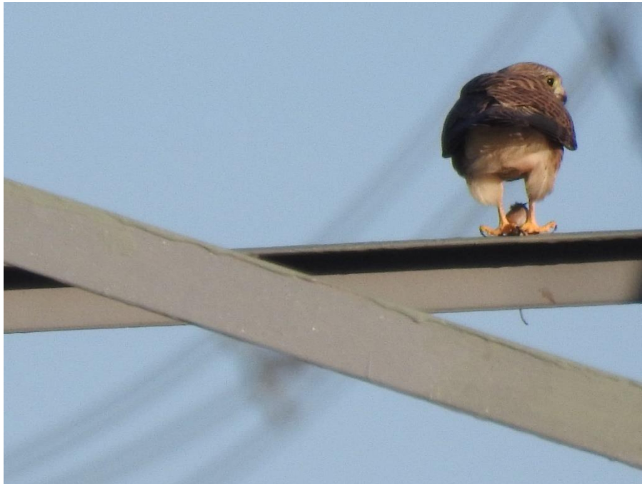
Torenavk met prooi.

Een stuk lager in de mast is nu een andere vogel te zien, vanaf de achterkant. Het duurt even voor ik door heb dat ik aankijk tegen biologische torenvalkdijen van een valk die zijn prooi bijna soldaat heeft gemaakt.