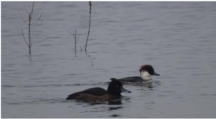
(Keus van redactie) Vr. kuifeend en vr. nonnetje