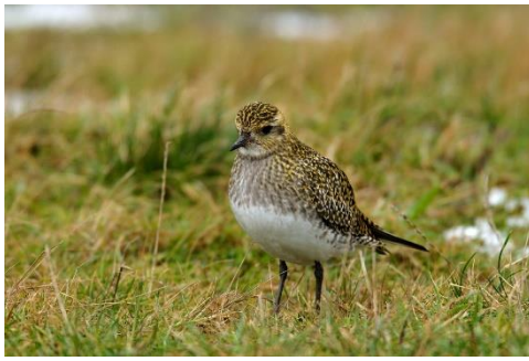
Goudplevier

fietsen. Ik zag dat de sloten hier hadden wél water hadden en ik voelde dat het pad moeilijker begaanbaar werd. Ik moest afstappen en dat bleek me goed uit te komen. Even verderop in wei op zat een groepje in elkaar gedoken vogels schichtig rond te kijken. Het bleken goudplevieren, acht stuks; ze zouden zijn opgevlogen als ik door was gefietst. Nu kon ik ze