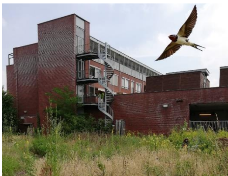
'De Tuin' met boerenzwaluw vliegend uit gebouw met laadperron van het winkelcentrum.

Dit geeft natuurlijk te denken; natuurverschijnselen staan nooit op zichzelf maar zijn verankert in hun omgeving. Voor vogels geldt dat rust (veiligheid), ruimte (structuur) en voedsel de drie basisvoorwaarden zijn voor vestiging op een bepaalde plek. Het is die combinatie die dit jaar toevallig daar aanwezig was. Door corona is het in het voorjaar in het centrum aanzienlijk stiller geweest als andere jaren. Die rust maakte het voor dieren makkelijker de menselijke bewoning op te zoeken. De Tuin is een groene open ruimte met veel biodiversiteit van wilde planten en van de planten afhankelijke insectensoorten. De vlinder, het Icarusblauwtje bijvoorbeeld, die we niet in aangeharkte plantsoenen vinden, zien we daar nog wel. Tenslotte is er de donkere open ruimte van het laadperron, die voor een boerenzwaluw niets anders is als een boerenschuur of stal. Het zijn omstandigheden die toevallig samenvielen waardoor het leefgebied gunstig werd voor deze soort. Dit voorval leert ons dat natuur dicht bij huis mogelijk is mits onze leefomgeving een zekere basiskwaliteit voor natuur in zich draagt. Het zou als gemeente goed zijn hiervoor meer aandacht te hebben bij de ontwikkeling en het beheer van groen in de openbare ruimte.