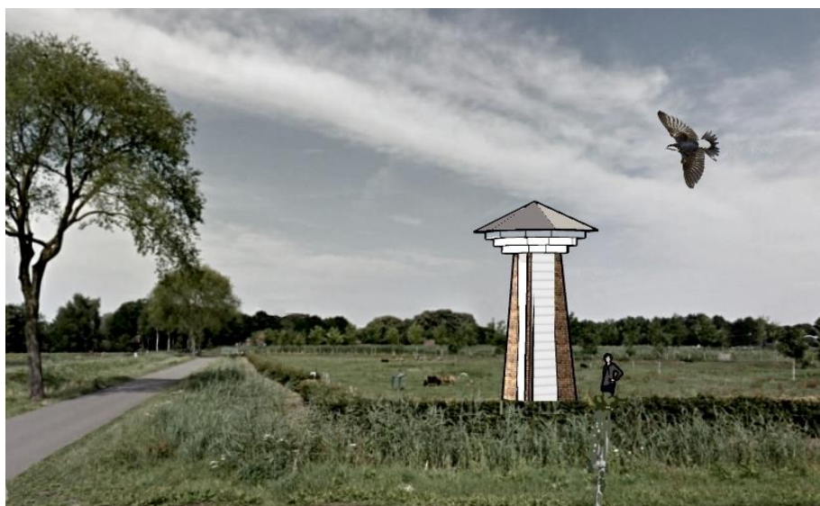
Artist impression van de biodiversiteitstoren in het landschap.