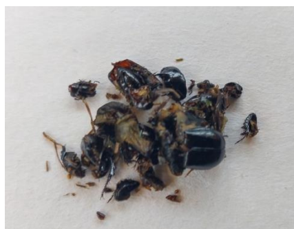
Keverresten uit braakbal van klapekster.