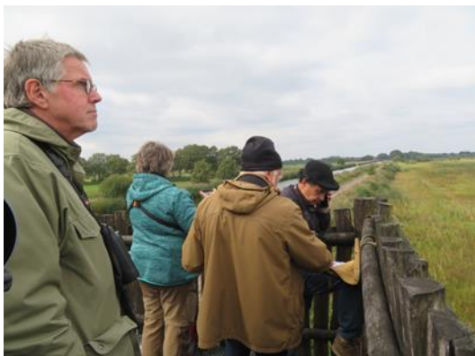
Uitkijk vanaf de Jac. P Thijsse uitkijktoren bij Haghorst.

Hildsven, Moergestel Banisveld, Oisterwijk/Boxtel De Soeperdonken Brinksdijk Vlagheide, Schijndel Logtse Velden, centrale post Jac.P Thijssetoren Haghorst