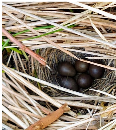
Op 12 april werd er ook een nestje tussen (dood) riet gevonden van een graspieper.