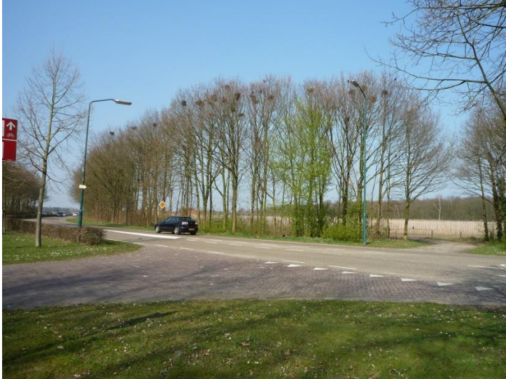
De roekenkolonie aan de Tilburgseweg ter hoogte van Grote Voort, maart 2017