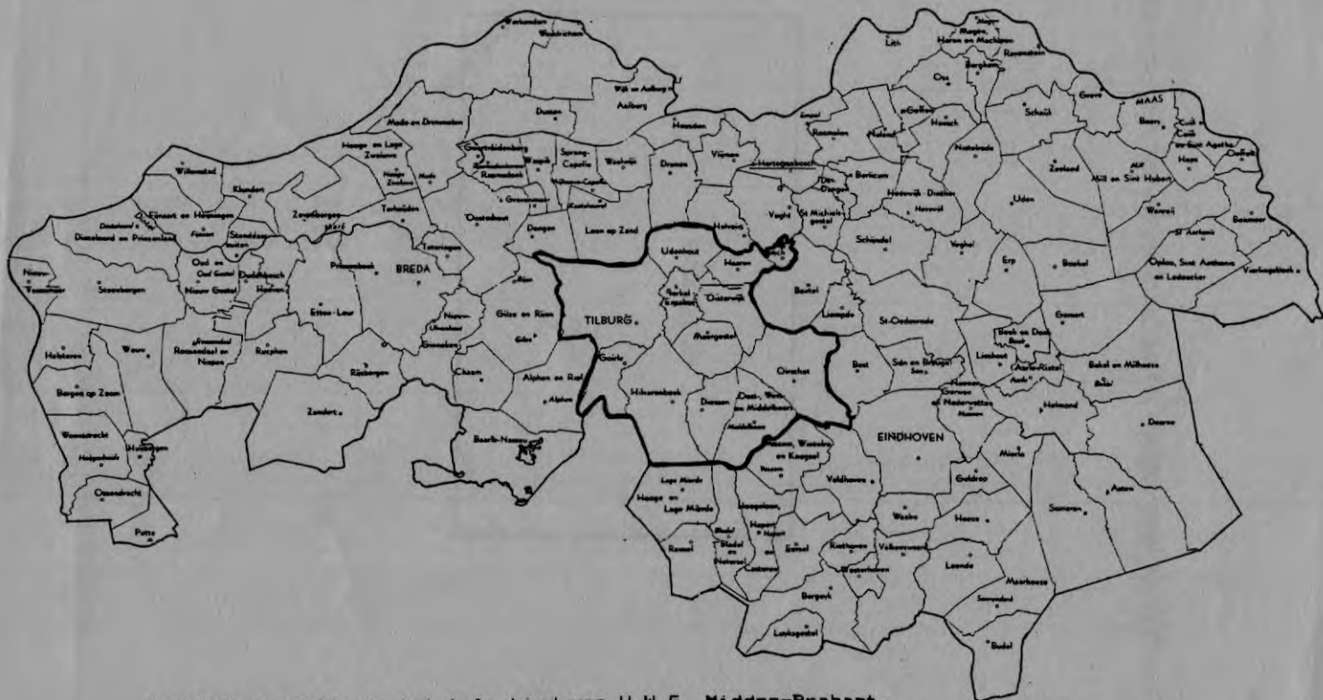
Omlinnde gedeelte is het telgebied van V.W.G. Midden-Brabant.