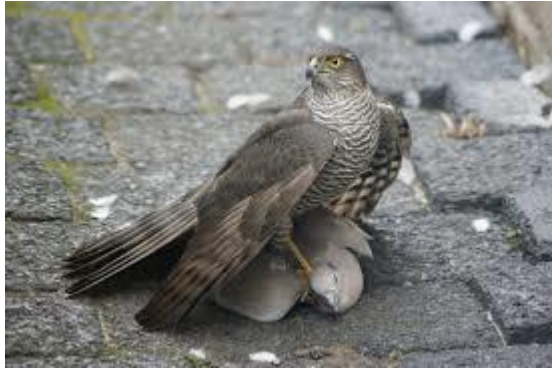
Haar grote bruine vleugels mantelend over een prooi waar ze met haar klauwen opstaat.

zich heen. Haar grote, bruine vleugels mantelend over een prooi waar ze met haar klauwen bovenop staat. Wat een kracht, wat een behendigheid tussen die tuinmuren, wat een lef. Ik ben een wat week type die het toch zielig vindt voor de prooi, al weet ik dat de sperwer vrouw moet eten en dat ze niet meer pakt dan ze nodig heeft. Ze vliegt op, er lopen misschien mensen langs die ik niet kan zien. Iets later zie ik haar over de tuin van de burens gaan, door de begroeiing van de bomen heen. Ik ga kijken of ik nog sporen vind. Een eindje