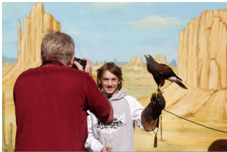
Voorbeeld: Een fotoshoot op een braderie waarbij een woestijnbuiserd als rekwisiet wordt gebruikt, is voortaan verboden