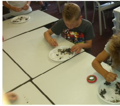
Kinderen van een basisschool uit Loon op Zand bezig met het uitpluizen van braakballen.