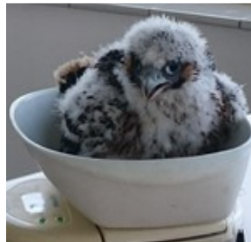
Ook dit jaar weer goed op gewicht.